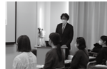
社会医療法人財団 石心会