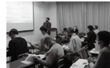
社会福祉法人 きらめき会