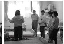
介護実技模擬授業の様子