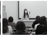
医療事務模擬授業の様子