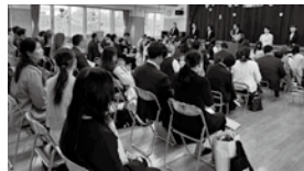
2歳児教室入園式の様子

プレ保育 たんぽぽ組も4月28日(火)に入園式がありました。これから、皆で元気に楽しく過ごしましょう。