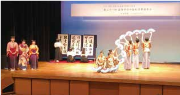
短歌書道部 県知事賞受賞 柏木学園高等学校