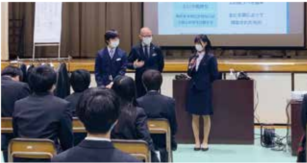
スーツ着こなし講演会 (3年) 大和商業高等専修学校