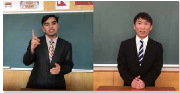
外国人留学生スピーチコンテスト 柏木実業専門学校