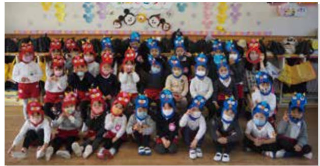
豆まき 都筑ヶ丘幼稚園