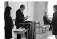
医療調剤介護事務・PC科