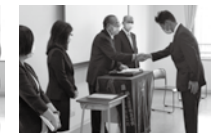
介護職員初任者研修科