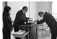
簿記パソコン事務科

9月29日(火)に簿記パソコン事務科、医療調剤介護事務・PC科、介護職員初任者研修科の修了式が行われました。新型コロナウイルス感染症拡大が懸念されるなかでの訓練受講ならびに就職活動ですが、受講生の真剣な取り組む姿勢が数多く見られました。