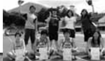
男子・女子 陸上競技部