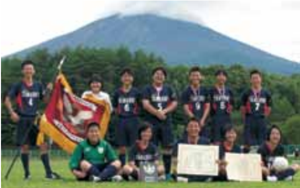
全国高等専修学校体育大会 大和商業高等専修学校