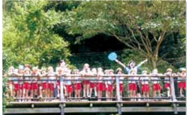
お泊まり保育 都筑ヶ丘幼稚園