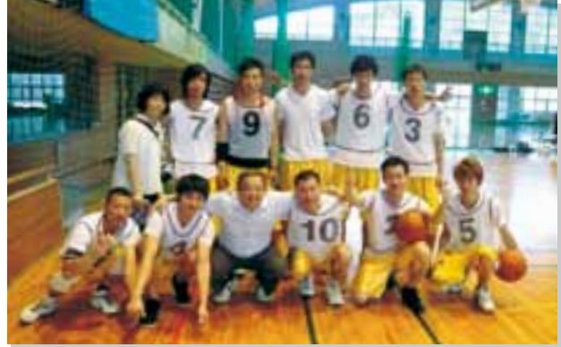
神奈川県専門学校体育大会 柏木実業専門学校