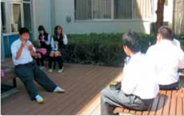
憩いのテラス完成 柏木学園高等学校