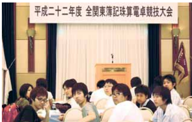
全関東簿記珠算電卓競技大会