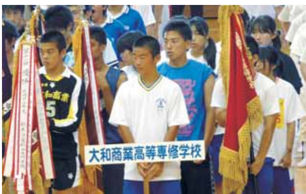
全国高等専修学校体育大会