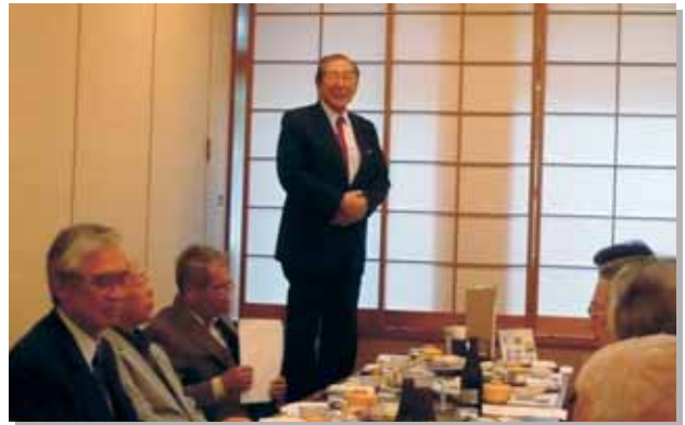
教育交流会・同窓会 役員会 柏木実業専門学校