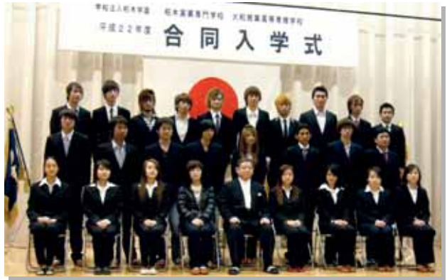
合同入学式 柏木実業専門学校