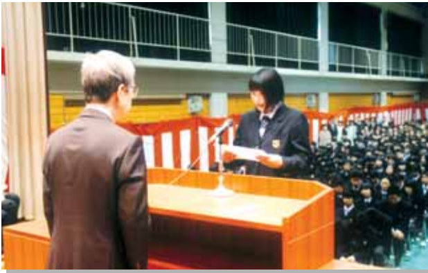
入学式・新入生誓いの言葉 柏木学園高等学校