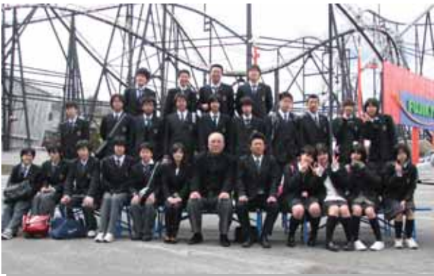
オリエンテーション 大和商業高等専修学校