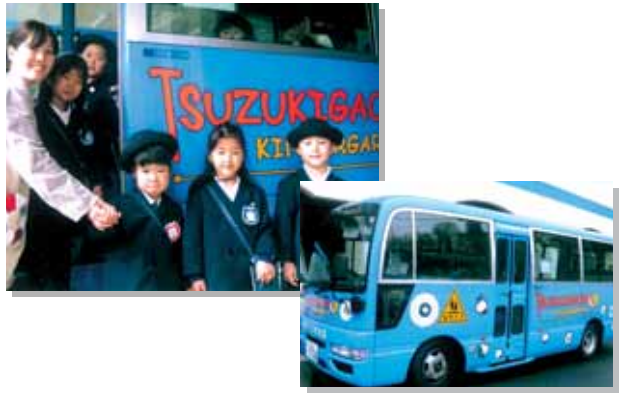
新学期が始まりました。 都筑ヶ丘幼稚園