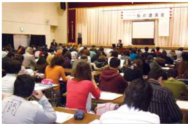
柏木学園 秋の講演会