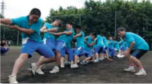
体 育 祭