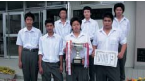
神奈川県高等専修学校体育大会 バスケット男子 優勝 大和商業高等専修学校