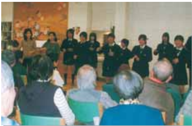
ボランティア活動(手話) 柏木学園高等学校