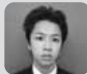
神奈川県専修学校各種学校協会賞