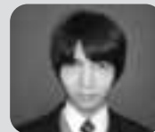
全国高等専修学校スポーツ奨励賞