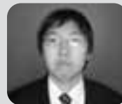
全国高等専修学校協会賞