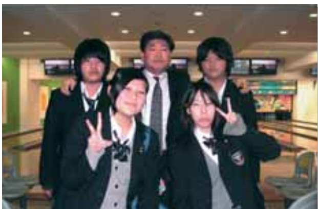
ボウリング大会 優勝 大和商业高等専修学校