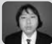
全国経理教育協会賞